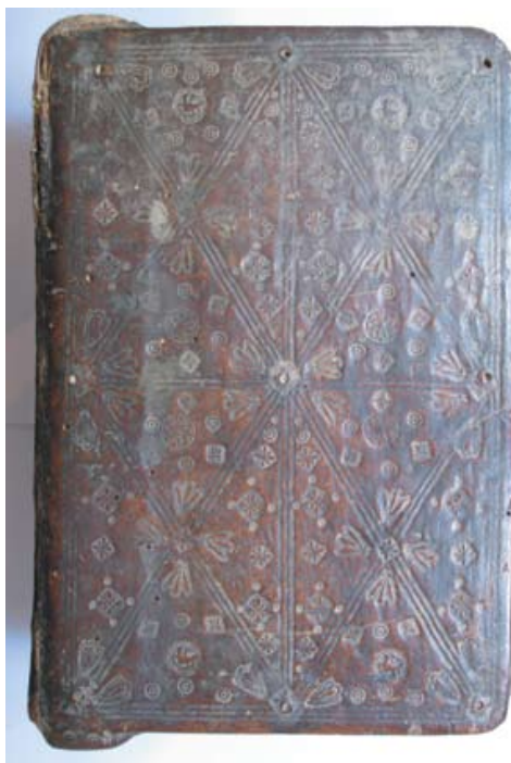
„Предање православне вере“ Јована Дамаскина, 1354/75 (бр.393)

У VI веку коптски повез помиње учени монах Касиодор у књизи Институције (Књ. I, поглавље 30) у којој јасно излаже монаси-